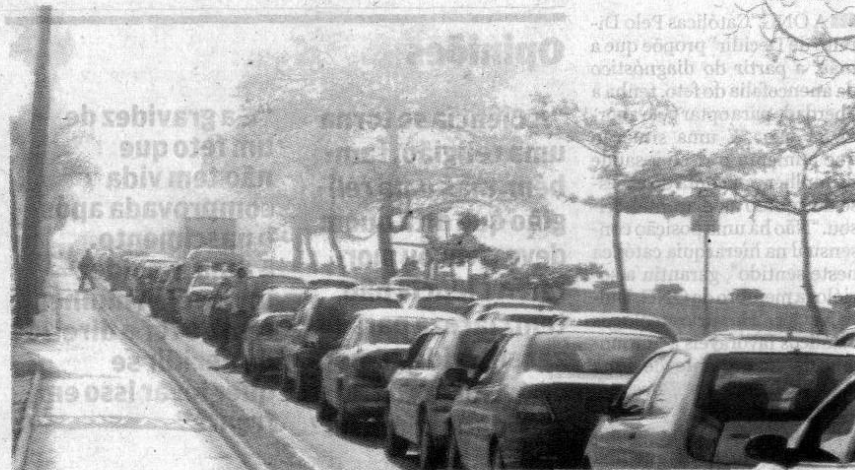
Na fila da balsa, os motoristas ficaram parados das 7h30 às 8h50. Problema afetou também as lanchas